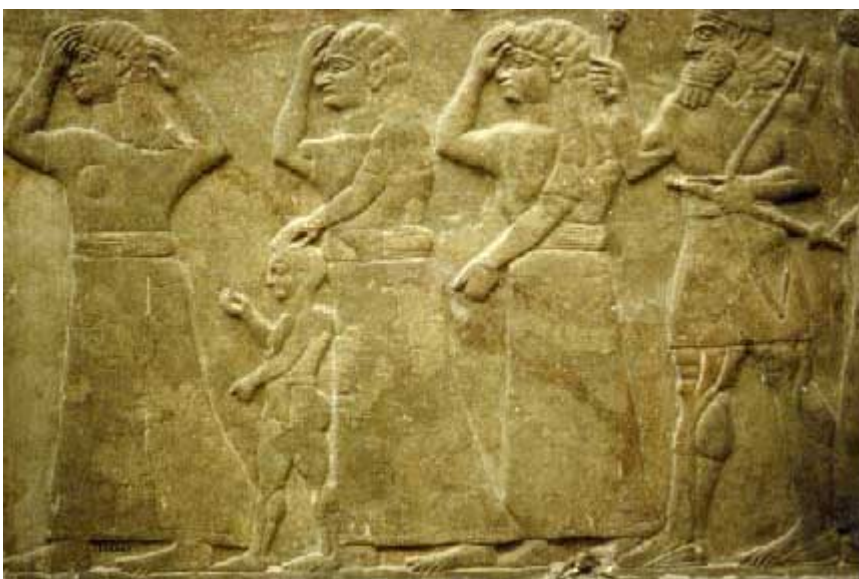
Abbildung 2: BM WA 124552 (Detail). In der Tabelle Nummer 69.