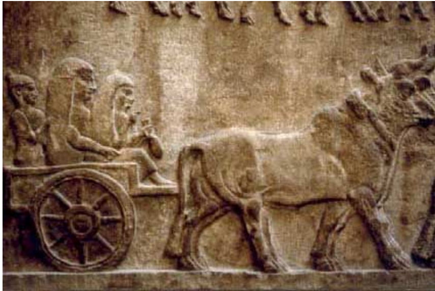
Abbildung 3: BM WA 118882 (Detail). In der Tabelle Nummer 85.