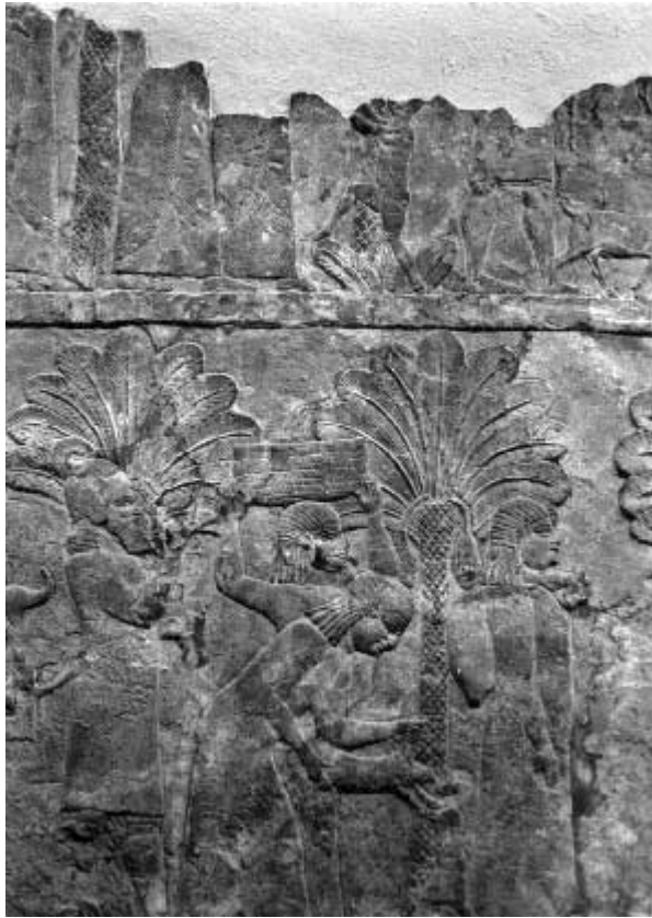
Abbildung 5: BM WA 124954 (Detail), © T. Staubli 1999. In der Tabelle Nummer 33 und 40.