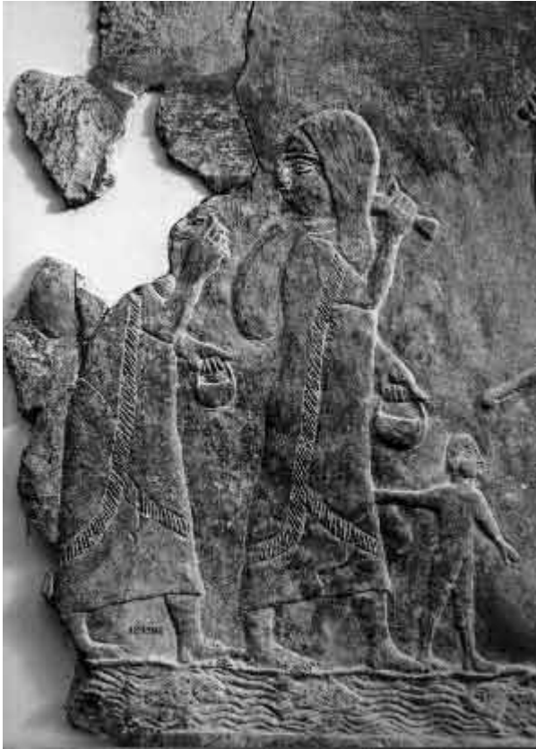
Abbildung 1: BM WA 124786 (Detail). In der Tabelle Nummer 54.

Alle Fotografien wurden mir von T. Staubli, Köniz, Schweiz, zur Verfügung gestellt, wofür ich ihm herzlich danke.